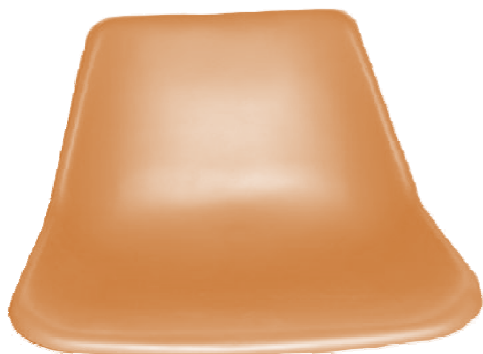
Seduta Modello S-800