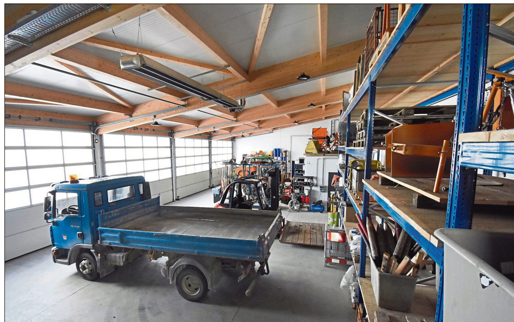
Die Fahrzeughalle im neuen Bauhof bietet viel Platz und ermöglicht effizienteres Arbeiten.