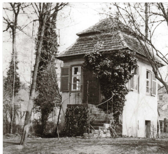
Das „Magenau-Häusle“ um 1910

... ist es, das einstige Dichterhäusle originalgetreu wieder aufzubauen und darin eine Erinnerungsstätte an den Dichterdreibund um Hölderlin, Neuffer und Magenau einzurichten und ihn so mehr ins Bewusstsein der Menschen zu bringen.