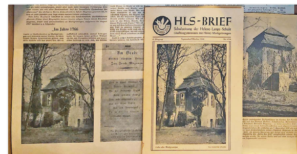
Artikel zum „Häusle“

In jene Stiftszeit von 1788 bis 1791 gehören auch zwei dokumentierte Besuche Hölderlins in Markgröningen. Es ist anzunehmen – auch wenn sich keine schriftlichen Quellen finden, die es belegen –, dass man im väterlichen Gartenhaus wie auch schon in Tübingen einen guten Rückzugsort fand, um sich die neuesten Schöpfungen ihrer Dichtkunst gegenseitig vorzutragen.