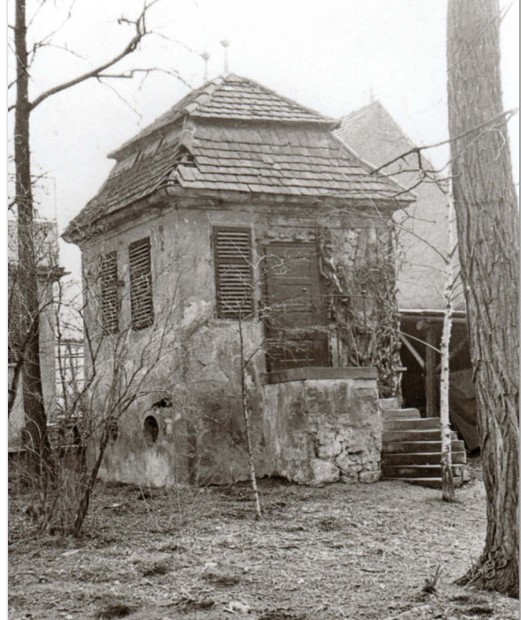
Gebäudeansicht von ca. 1965

Es stand bis zum Frühjahr 1972 versteckt zwischen Bäumen, an denen wie an seiner Pforte Efeu emporrankte, verträumt und verlassen