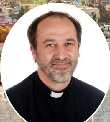
Pr. Moisés Agudo