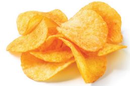
PATATAS FRITAS Y BOTANAS