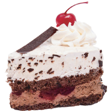
PRODUCTOS DE PANADERÍA

POR FAVOR, NO INCLUYA LOS SIGUIENTES ARTÍCULOS, YA QUE CONTAMINARÁN EL MATERIAL QUE RECOGEMOS PARA COMPOSTAJE: