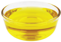
PEQUEÑAS CANTIDADES DE ACEITES Y GRASAS