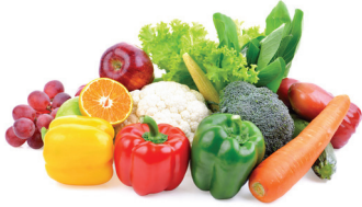
FRUTAS Y VERDURAS