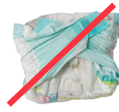
DESECHOS DE MASCOTAS O PAÑALES