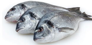
PESCADO Y MARISCOS