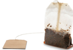
BOLSITAS DE TÉ