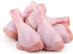
CARNE Y AVES