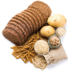
PAN, CEREALES, ARROZ Y PASTA