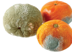
SOBRAS Y ALIMENTOS EN MAL ESTADO