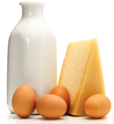
PRODUCTOS LÁCTEOS Y CÁSCARAS DE HUEVO