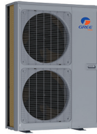
Condenseur 60 000 BTU/h