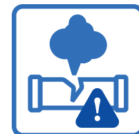
Détecteur de fuite sur TOUS les cabinets