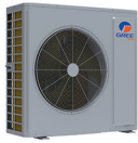
Condenseur 36 000 BTU/h