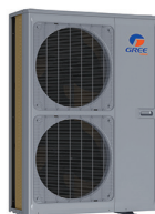
Condenseur 60 000 BTU/h