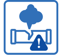
Détecteur de fuite sur TOUS les serpentins