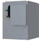
Serpentin en caisson UNIX R32