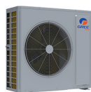
Condenseur 36 000 BTU/h