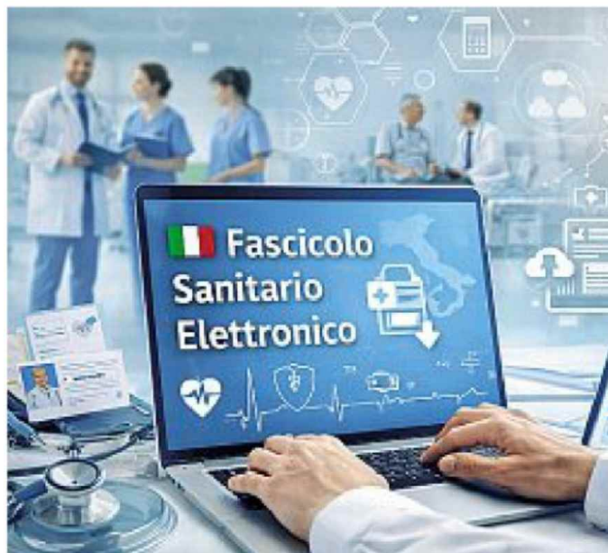
Operativo Il Fascicolo sanitario elettronico andava chiuso entro il 31 marzo