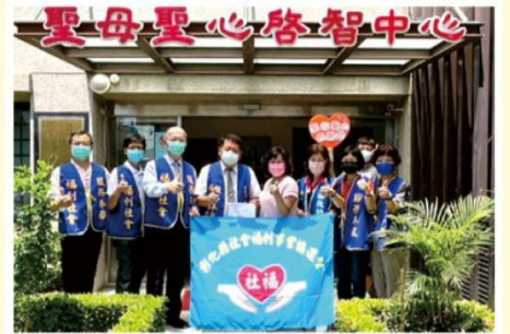
08/16 彰化社會福利事業協進會