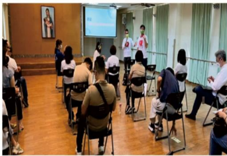
07/22 中華存善關懷協會