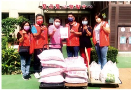
08/30 聖德慈善文化協會