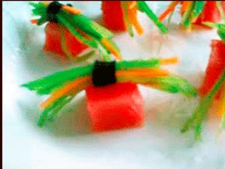
Atado de verdura con miel