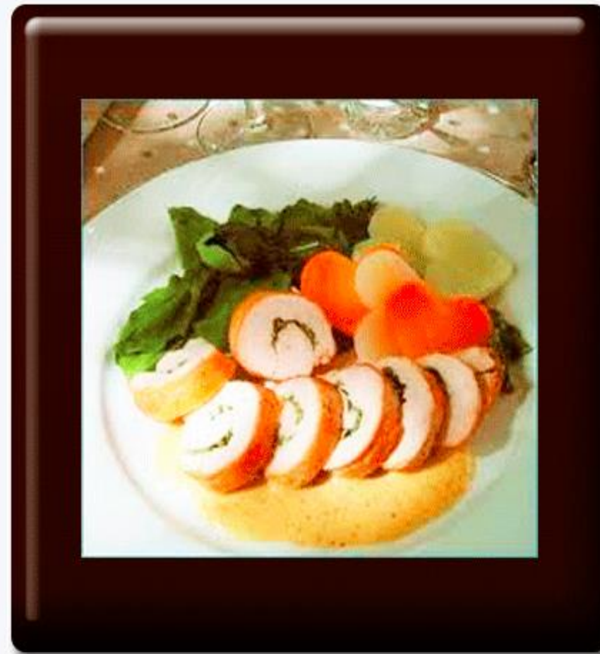
Rollitos de pechuga rellena de flor de calabaza