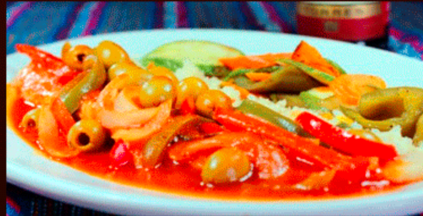
Pescado a la Veracruzana