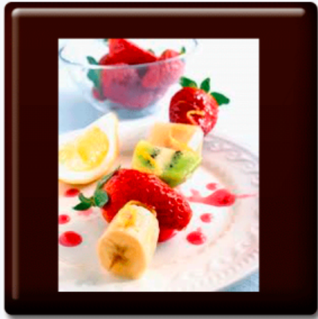
Brochetas de frutas con salsa de mango