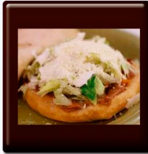
Bocados Mexicanos ( Sopecitos)