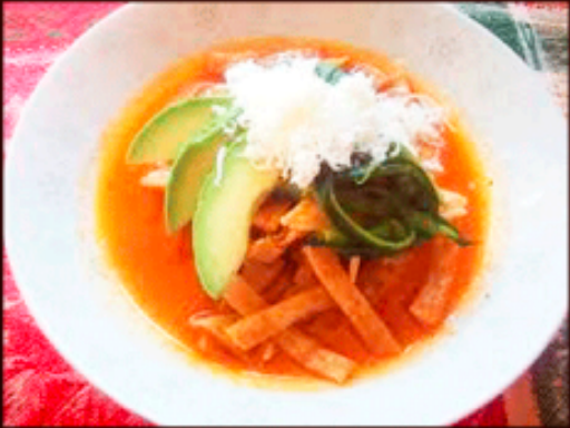
Sopa de Tortilla