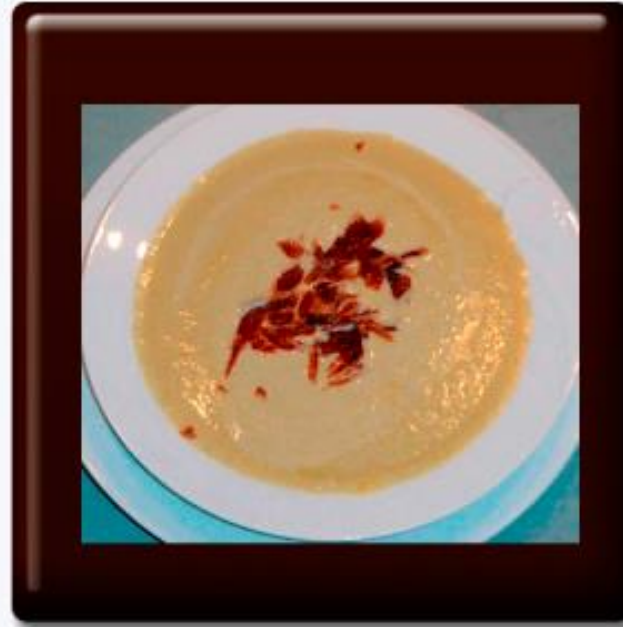
Crema de Alcachofa