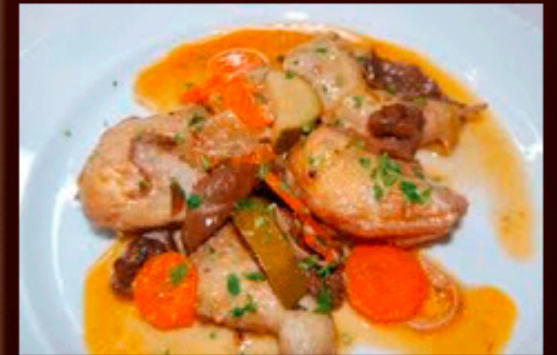
Codorniz al Jerez