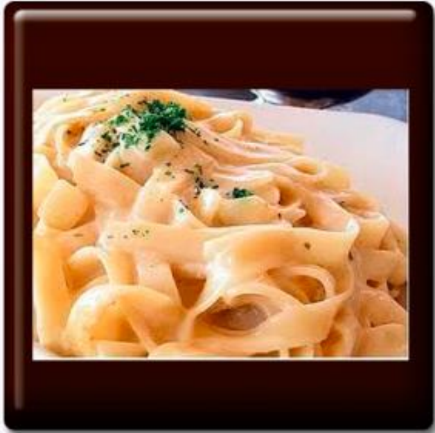
Fettuccine a la crema