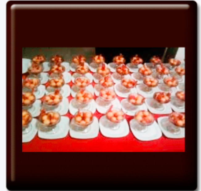
Perlas de melón al oporto