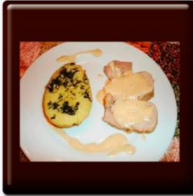
Lomo al vino blanco