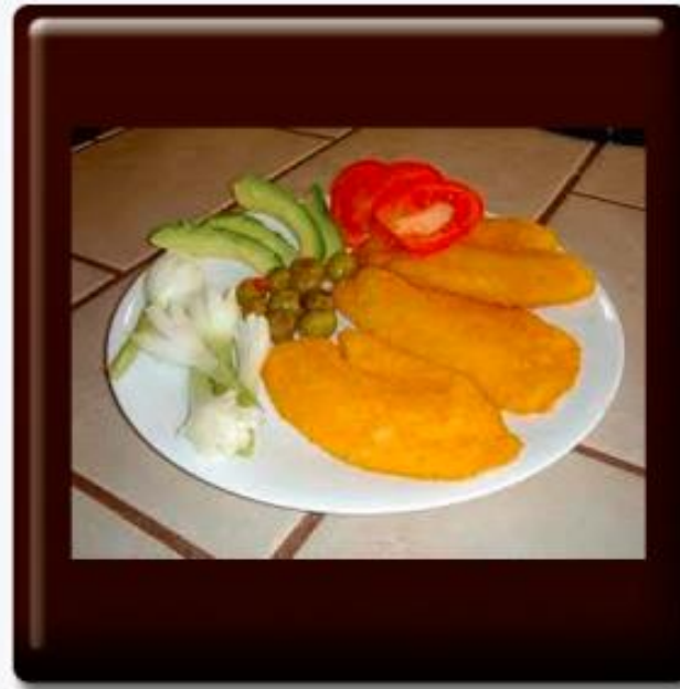
Filete de pescado Sol