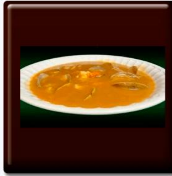
Sopa de pescado