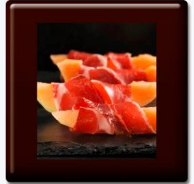
Melón con Jamón Serrano