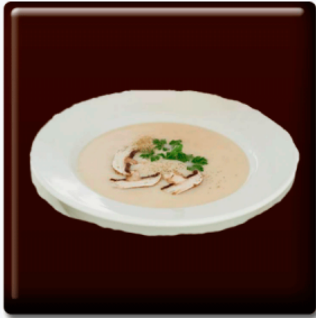
Crema de Champiñones