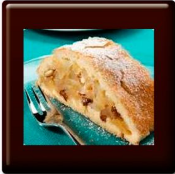
Strudel de Manzana