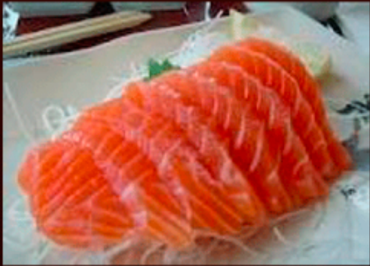
Salmon a las finas hierbas