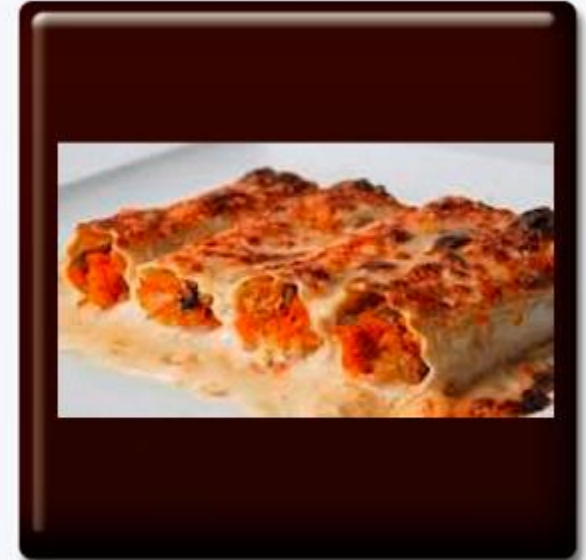
Canelones a la Italiana