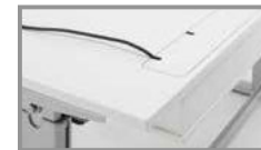
RMF Kabelausslass RMF cable duct RMF cable outlet