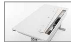
RMF Kabelkanal RMF cable duct Canal pour câbles RMF