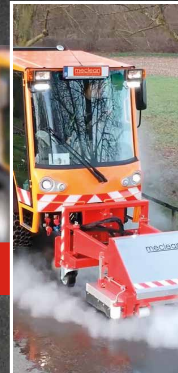
URBAN CLEANING LINE