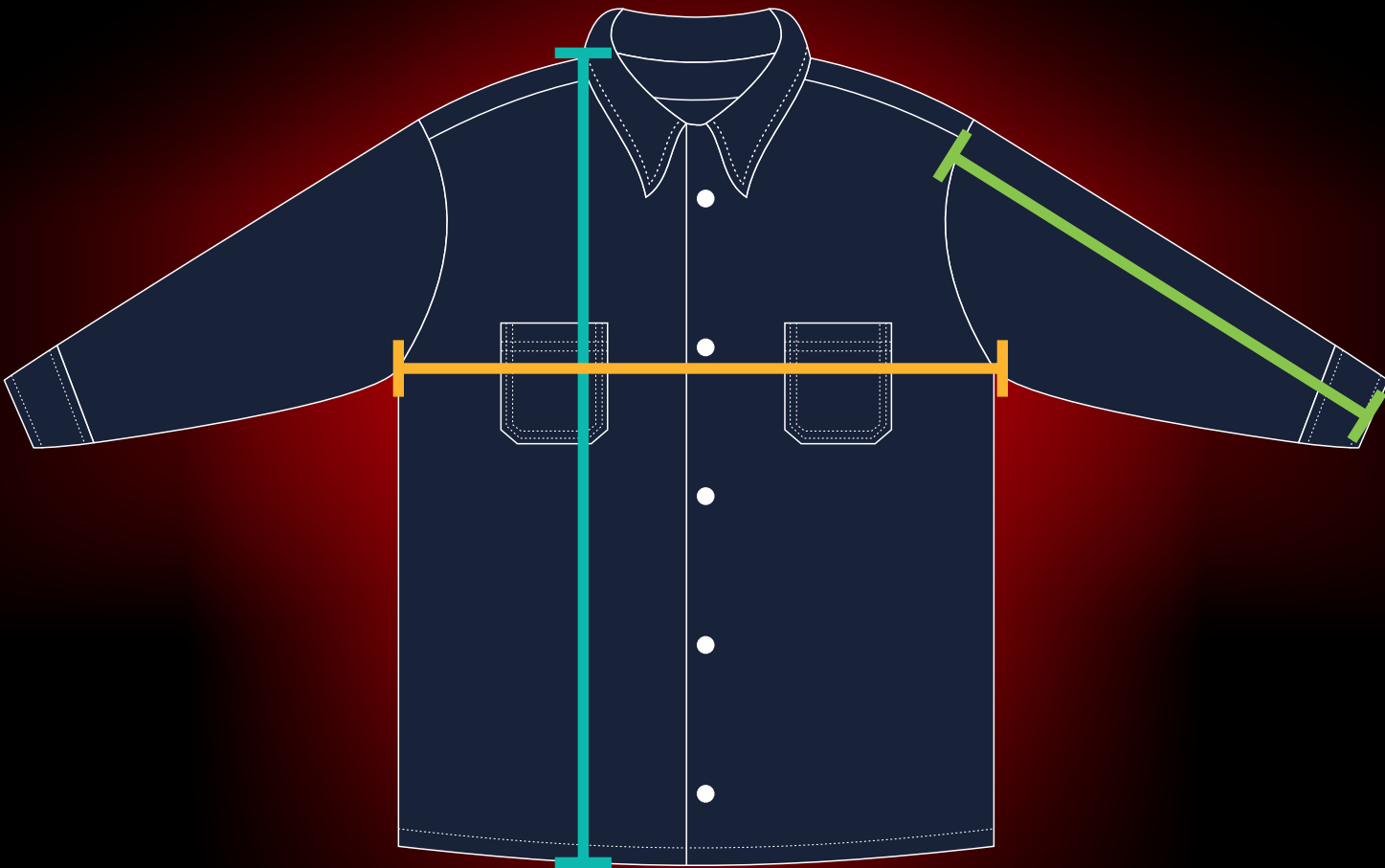
TABLA DE MEDIDAS