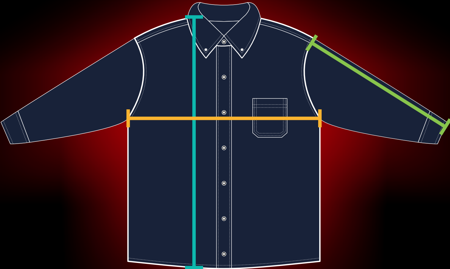
TABLA DE MEDIDAS