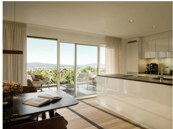
Aussicht Attikawohnung W8