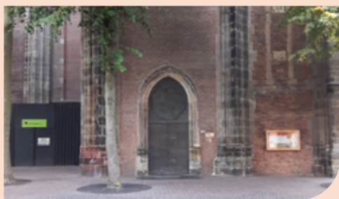
De gesloten Domkerk.

Al vele eeuwen lang klinkt het geluid van kerkklokken over Europa. Alles wijst erop dat gegoten klokken met een aangename klank en een flink geluidsbereik een West-Europese ‘uitvinding’ van de vroege middeleeuwen (6e tot 9e eeuw) zijn. Vooral kloosters hebben hier een rol in gespeeld. De kloosterlingen hadden met hun verfijnde liturgische dagorde behoefte