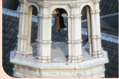
Een profaan klokje op het Academiegebouw te Utrecht.

Juist in een wereld vol van ‘communicatie’ en met een overvloed aan visuele en akoestische impulsen kunnen klokken een heilzame werking hebben. Door hun natuurlijke geluidsvoortbrenging en door hun gelimiteerd gebruik doorbreken ze de permanente mechanische en digitale ruis van het moderne leven. Klokken maken “geluid dat de stilte vergroot”, zegt Luc Rombouts. Net zoals kerkgebouwen zullen klokken in een samenleving die van hun oorspronkelijke context en betekenis is vervreemd aan een groeiende behoefte kunnen voldoen, vanwege hun belangeloosheid, hun openheid voor individuele perceptie en beleving, maar ook door hun vermogen te verbinden. Dat zijn