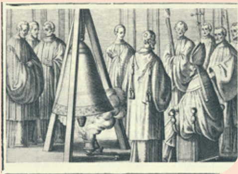
Het wierookoffer tijdens de klokwijding: Pontificale Romanum 1595, illustratie bij De benedictione signi, vel campanae .

De kerkklok zelf is een sacraal voorwerp , dat wil zeggen dat ze specifiek bestemd is voor kerkelijk gebruik en daartoe 'geheiligd' wordt. Dit gebeurt bij de wijding van een nieuwe klok, die al sinds de vroege middeleeuwen bestaat uit een besprenkeling met wijwater, een zalving en een bewieroking, uit te voeren door de bisschop. De bijbehorende gebedsteksten onderstrepen de symboliek van reiniging, tekening met heiligheid en het opstijgende gebed. Dat het ritueel ook magische kanten heeft is duidelijk, temeer ook omdat het eigenlijke wijdingsgebed de klok de kracht toekent om kwade geesten en storm, donder en hagel te verjagen. Intussen wordt voortdurend verwezen naar de Joodse voorgangers voor het christelijk klokgelui: de zilveren trompetten waarmee Mozes het volk liet oproepen. 2 Tenslotte voorziet het ritueel ook in de toewijding aan een speciale heilige, waardoor de klok een naam krijgt. Klokken zijn in de middeleeuwen een hoorbare uitdrukking van christelijk geloof .