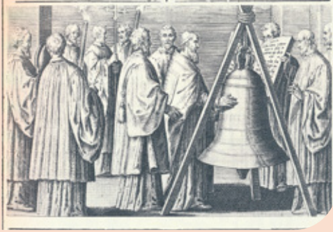
De bisschop zalft de nieuwe klok: Pontificale Romanum 1595, illustratie bij De benedictione signi, vel campanae .

aan goed hoorbare signalen om hen naar de kerk te roepen. De geleidelijke ontwikkeling van klokken ging hand in hand met die van kerktorens, hoewel de wisselwerking tussen beide nog lang niet duidelijk is. Door de internationale vertakkingen van het kloosterwezen verspreidde het verschijnsel van de torens met klokken zich over het uitgestrekte territorium tussen de Britse eilanden, Spanje, Italië en de Germaanse binnenlanden. Kloosters dienden vervolgens als voorbeeld voor kathedralen en parochiekerken.