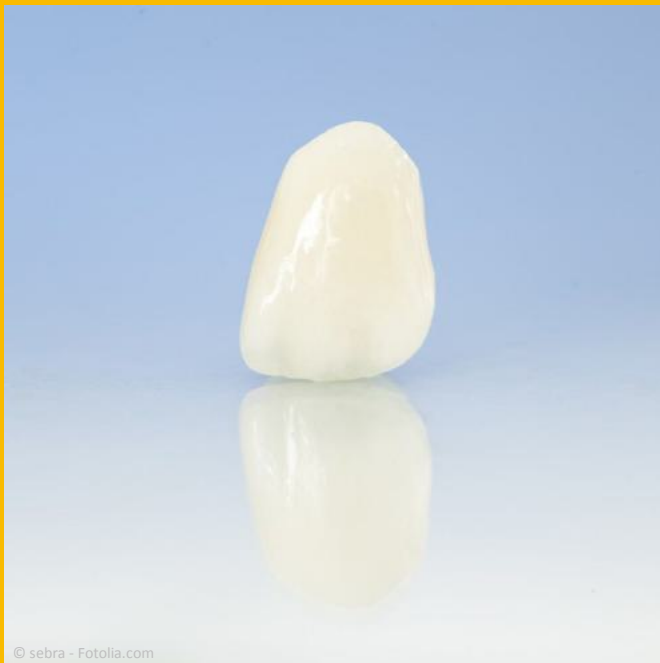
Einzelnes Keramik-Veneer: Natürliche Form und Farbe, die nach den Wünschen des Patienten gestaltet werden können

Da Veneers hauchdünn sind, müssen die Zähne dafür kaum oder gar nicht abgeschliffen werden. Veneers werden in einem speziellen Verfahren (der sog. Adhäsivtechnik) fest und dauerhaft auf den Zahnoberflächen befestigt. Obwohl sie sehr dünn sind, haben Veneers dadurch eine sehr lange Haltbarkeit, die nach unserer Erfahrung bei über 20 Jahren liegen kann.