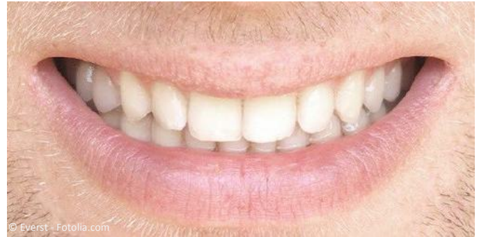
Nachher: Farblich individuell angepasste, geschichtete Komposit-Füllung, die nicht sichtbar ist.

Bei Schneide- und Eckzähnen kommt es besonders darauf an, dass Füllungen nicht sichtbar sind. Das verlangt einige Kunstfertigkeit, weil die Zähne in sich verschiedene Farbnuancen haben: Sie sind im Zahnhalsbereich dunkler und zur Schneidekante hin heller und etwas transparent.