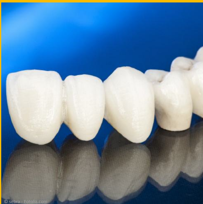
Zahnbrücke aus reiner Keramik: Reizt nicht das Zahnfleisch und es sind keine dunklen Metallränder sichtbar.

Zahnersatz soll nicht nur so beschaffen sein, dass man damit alles essen kann, was man mag. Er soll auch natürlich aussehen und vor allem gut körperverträglich sein.