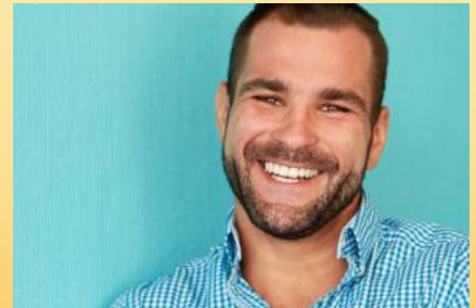
Unsichtbare Zahnfüllungen aus Komposit & Keramik