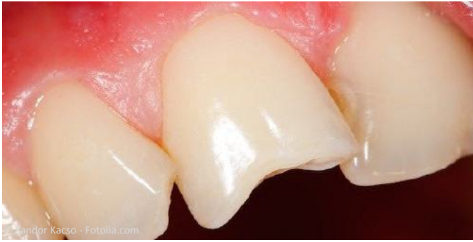
Vorher: Abgebrochene Ecke an einem Schneidezahn