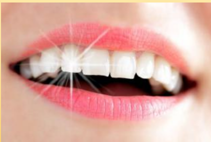
Weißer Zähne mit Bleaching (Zahnaufhellung)