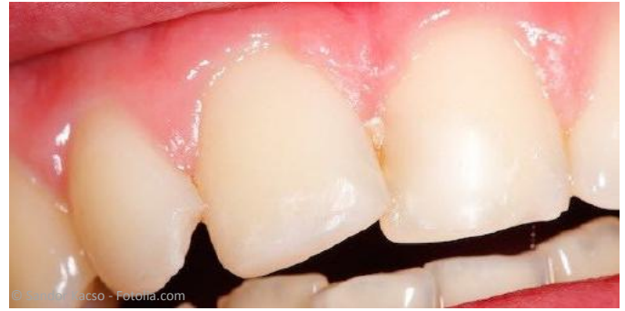
Nachher: Eckenaufbau aus Komposit als Soforthilfe

Manchmal haben Zähne auffällige Schönheitsfehler, die störend wirken: