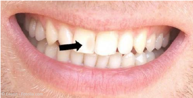
Vorher: Einfache Kunststoff-Füllung an einem Schneidezahn, die als dunkler Fleck sichtbar ist.