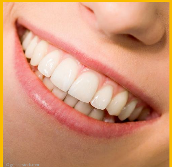
Attraktiv: Glatte Zahnoberflächen ohne Beläge und ein gesundes Zahnfleisch