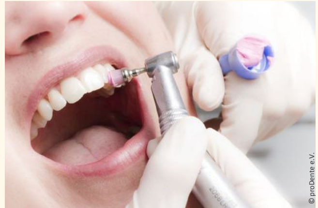
Die Professionelle Zahnreinigung wird von speziell ausgebildeten Prophylaxe-Fachkräften ausgeführt und ist eine lohnende Investition in die eigene Gesundheit.

Sie ersparen sich oft Kronen, Implantate und Zahnfleischoperationen.“