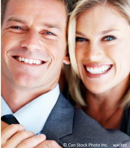
Selbstsicher mit gepflegten Zähnen

Dann werden Mund, Zähne und Zahnfleisch untersucht. Die Zahnbeläge werden angefärbt, um sie besser sichtbar zu machen und es wird die Tiefe der Zahnfleischtaschen gemessen.