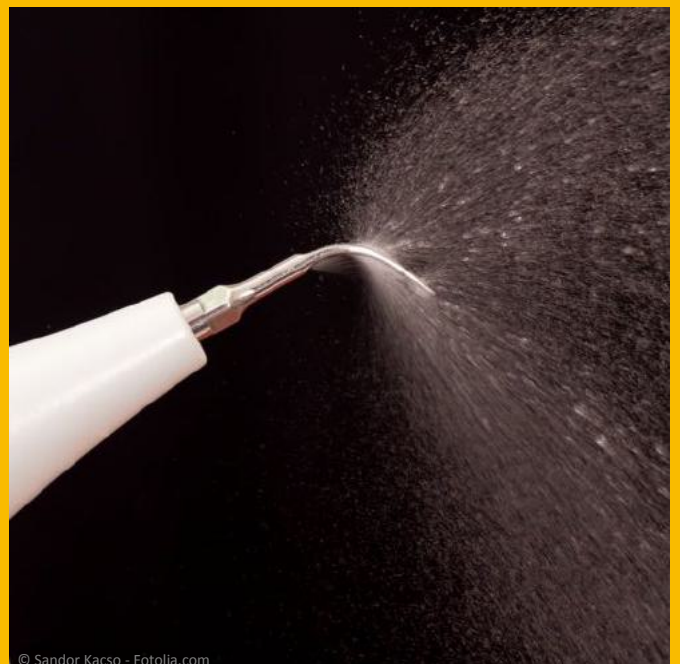
Wassergekühlte Ultraschallspitze für die Entfernung harter Beläge von den Wurzeloberflächen und zur Säuberung der Zahnfleischtaschen

Persönliche Beratung: Telefon: 06762 - 96 34 63