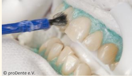
Power-Bleaching beim Zahnarzt: Auftragen des Bleaching-Gels

Wenn Sie die Praxis wieder verlassen, können Sie sich an sichtbar helleren Zähnen freuen!