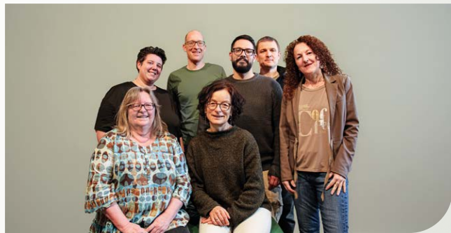
Unser erfahrenes Leitungsteam

Wenn eine schwere, unheilbare Erkrankung fortschreitet, treten oft belastende Symptome, Unsicherheit und viele Fragen auf, sowohl für Betroffene als auch für ihre Zugehörigen. In dieser schwierigen Zeit unterstützen, begleiten und sorgen wir für Entlastung.