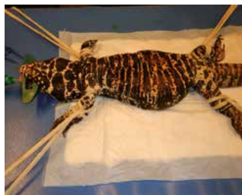
Fig. 5: Argentijnse zwart-wit teju onder narcose met rechts abdominale zwelling.