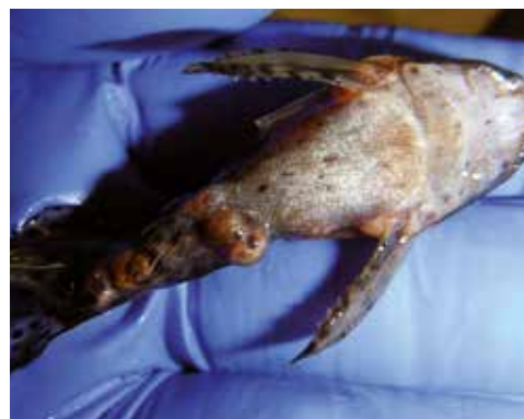
Fig. 12: Beardmeerval.