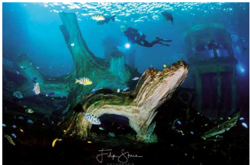
Fig. 1: TODI Duikercentrum Be-Mine Beringen.

“Wat schildpadden betreft, zien we bepaalde piekperiodes: vóór en na de winter willen mensen zoveel mogelijk info verzamelen om fouten te voorkomen. Zo zien we na de winter veel schildpadden met symptomen van lever- en nierfalen. De complicaties bij