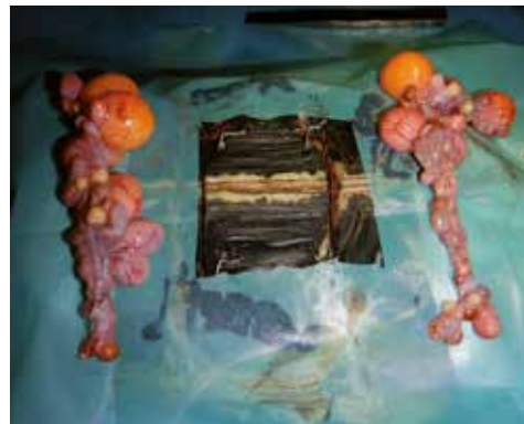
Fig. 2: Ovariëctomie landschildpad Luc Lambrechts.

Één van de mooiste ervaringen is dat ik de schildpadden echt kon leren kennen. Ik kon ook met hen bezig zijn op aangename momenten (waar er geen spuitjes bij betrokken waren). Zo is ook de groene