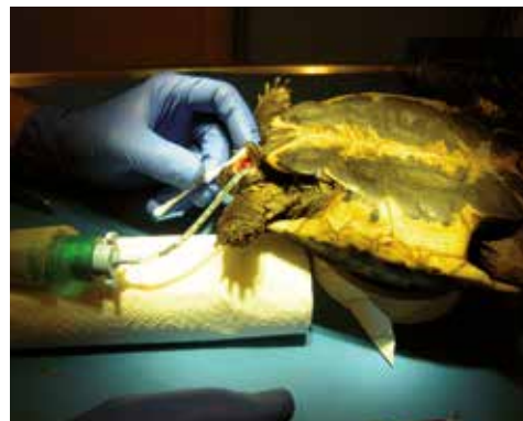
Fig. 3: Stabilisatie met kunstthars.