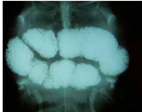
Fig. 10: RX darmobstructie bij geelwangsierschildpad.

“Lees veel, er zijn veel interessante tijdschriften en boeken. Volg veel bijscholingen en doe ervaring op waar mogelijk in het houden en verzorgen van deze dieren. En ook heel zinvol: leg contacten met andere dierenartsen. Deel je kennis en zie elkaar als concullega’s in plaats van concurrenten. Zoek hulp bij personen die het wél weten. Dat is net het fijne aan de job. In de diergeneeskundige faculteit in Merelbeke is er nu ook een ervaren team voor bijzondere diersoorten, maar ook binnen SAVAB is er de VOBD. En dan een laatste tip: VEEL SCHILDPADDENGEDULD!