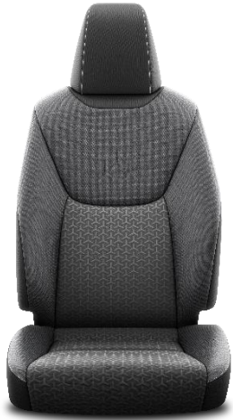
Sitzbezug Stoff schwarz