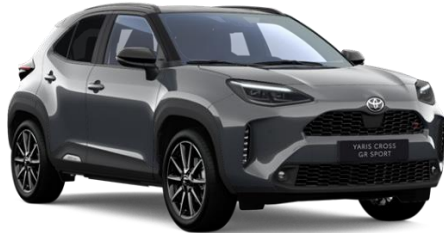
M29 Storm Grey Metallic / Black