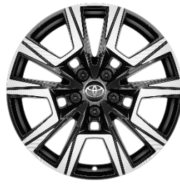
18" Leichtmetallfelge 10 Speichen Schwarz/silber