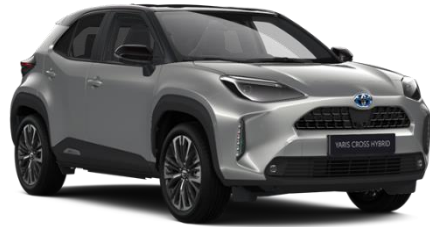
2VU Silver Metallic / Black