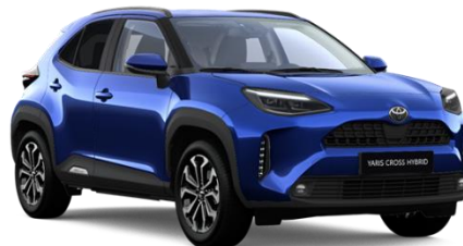
8Y8 Juniper Blue Metallic