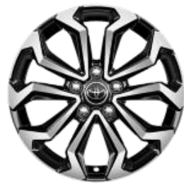
17" Leichtmetallfelge 5 Doppelspeichen schwarz/silber