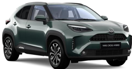
6X7 Everest Green Metallic