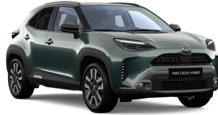
M39 Everest Green Metallic / Black