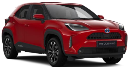
3U5 Emotional Red Metallic