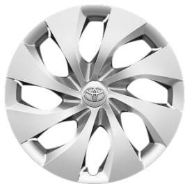
16" Stahlfelge silber