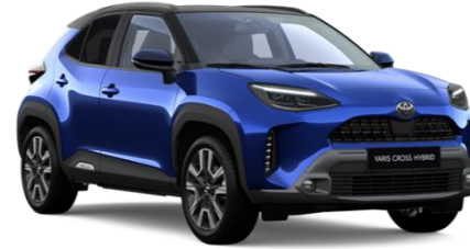
M20 Juniper Blue Metallic / Black