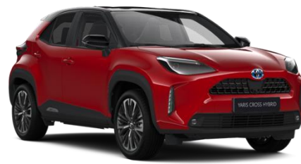
2SZ Emotional Red Metallic / Black

Erfahrungsgemäß können Druckfarben den Farbton von Lackierungen nicht originalgetreu wiedergeben. Abb. MY22