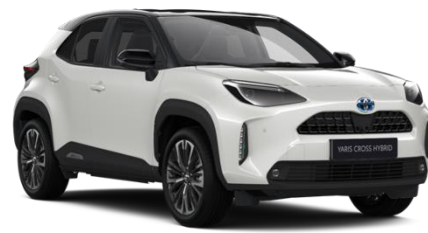
2PU Platinum Pearlwhite Metallic / Black