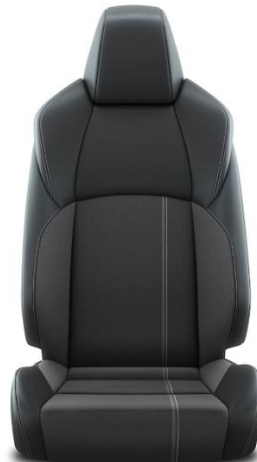
Sitzbezug Stoff mit Textilleder-Applikationen 1 taupe