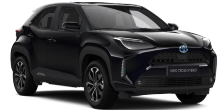
209 Night Sky Black Metallic