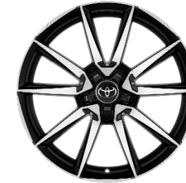
18" Leichtmetallfelge 5 Doppelspeichen schwarz/silber