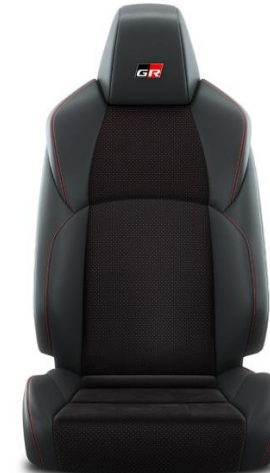
Sitzbezug Ultrasuede™ mit Textilleder-Applikationen schwarz und roten Ziernähten