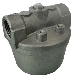
Filtro a rete in acciaio INOX

Per diesel e benzina. Filtrazione impurità. Capacità filtrante 60µm. Portata 50 lt/min