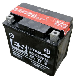
Batteria al piombo con carica batteria (presa europea tipo C)

Vasca di contenimento pieghevole e portatile