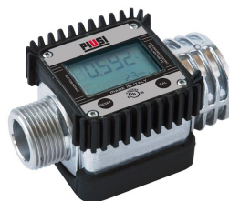
Contaltri digitale per benzina K24 ATEX

Per diesel e benzina. Filtrazione impurità. Capacità filtrante 60µm. Portata 50 lt/min