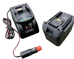
Batteria al manganese 12V o 24V con carica batt (presa accendisigari) e slot per batt.