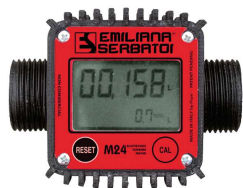
Contaltri digitale per diesel M24