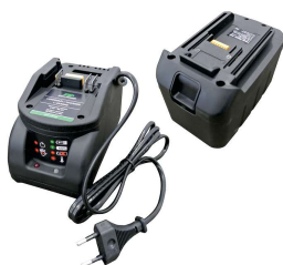
Batteria al manganese 12V o 24V con carica batt (presa europea tipo C) e slot per batt.