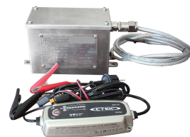
BATTERIA ATEX con carica batteria (presa europea tipo C)