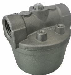
Filtro a rete in acciaio INOX

Per diesel e benzina. Assorbimento acqua e filtrazione impurità. Capacità filtrante 10µm. Portata 70 lt/min