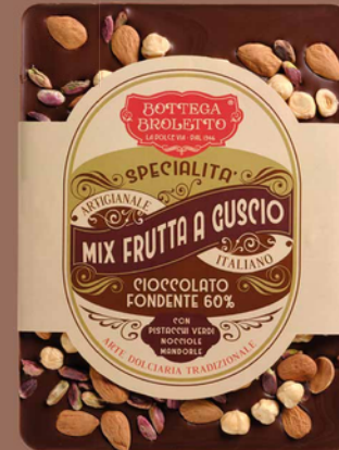
Mix nocciole, mandorle e pistacchi

Ingredienti: PISTACCHI BRONTE D.O.P.20%, pasta di cacao, zucchero, burro di cacao, emulsionante: lecitinadi SOIA, aroma naturale di vaniglia. Può contenere tracce di: glutine, soia, uova, lupino, sesamo, senape, latte, frutta a guscio.