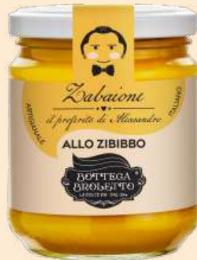
Zabaione allo Zibibbo

Un ottimo Zibibbo rigorosamente siciliano dona una nota aromatica di uva passa a questa crema che in bocca sembra seta. Da mangiare col cucchiaino senza sensi di colpa, è perfetta spalmata sul nostro Panettone o come crema golosa per i nostri frollini e i nostri bauletti.