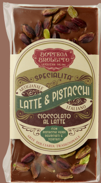
Pistacchi al latte