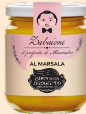
Zabaione al Marsala

Ingredienti: zucchero, vino Zibibbo 29% (contiene SOLFITI), tuorlo d'UOVO 24%, vino Marsala (contiene SOLFITI) amido di mais. Può contenere tracce di: glutine, soia, lupino, sesamo, senape, latte, frutta a guscio.