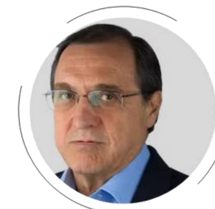
Carlos Alberto Sardenberg