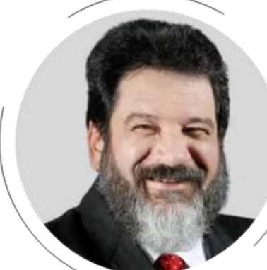
Mário Sérgio Cortella