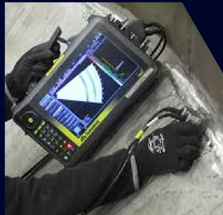
Ultrassom Convencional e Phased Array