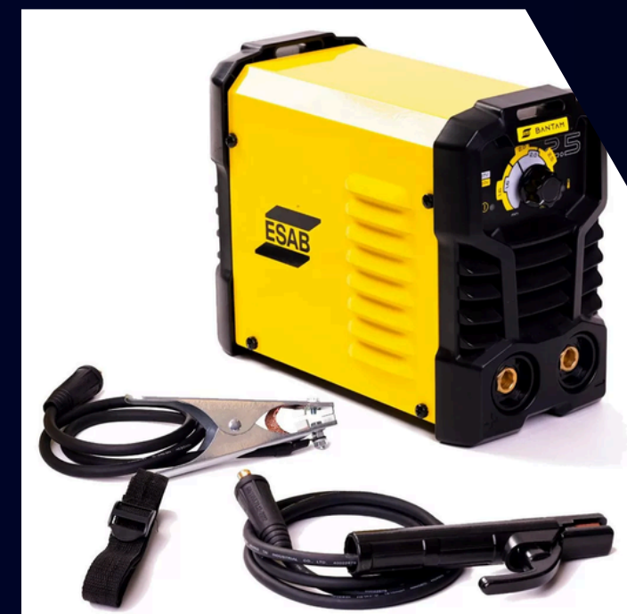
Aferição de Maquina de Solda