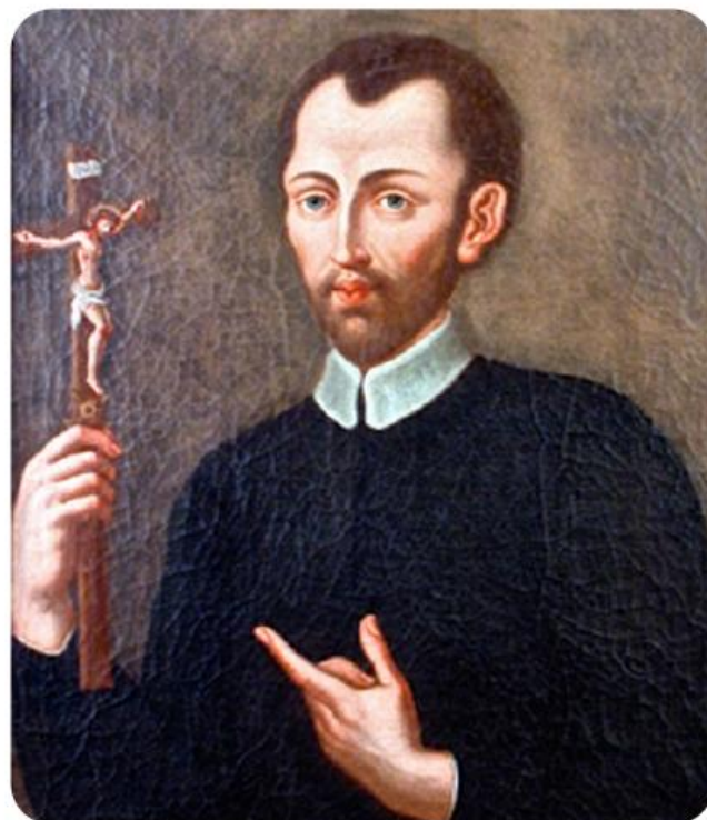
Saint Alphonsus Liguori

Khi suy niệm về Thánh Tâm Chúa Giêsu và tình yêu bao la của Đức Kitô dành cho nhân loại, chúng ta nhìn lại những thiếu sót của mình trước tình yêu ấy và nhận ra nhu cầu phải đền tội. Chúng ta cũng dành giây phút này để sám hối như một quốc gia vì những lỗi lầm trong quá khứ của đất nước mình. Chúng ta hãy cầu xin ơn tha thứ và chữa lành cho những tổn thương do các tội lỗi ban đầu của quốc gia gây nên, đặc biệt là chế độ nô lệ và nạn phân biệt chủng tộc. Một yếu tố cốt lõi của lòng sùng kính Thánh Tâm là đền tạ , nghĩa là sửa lại những điều sai trái mình đã gây ra, xin Đức Kitô tha thứ tội lỗi chúng ta và biến đổi tâm hồn chúng ta để biết yêu thương như Người yêu thương. Chúng ta hãy cùng cầu nguyện với thánh Anphongsô Ligôri, Đấng sáng lập Dòng Chúa Cứu Thế: