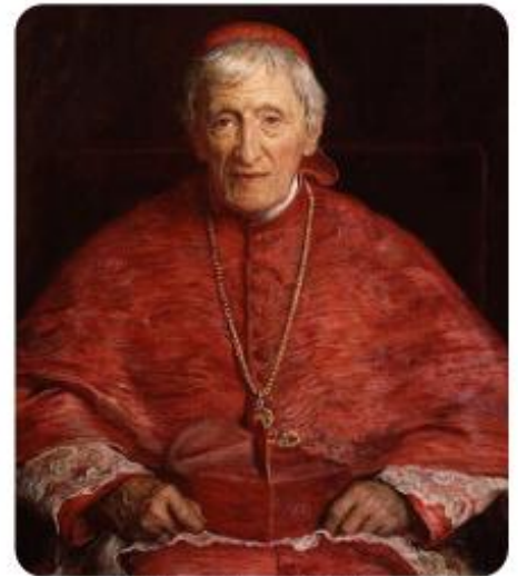
John Henry Newman by Sir John Everett Millais

Thánh Gioan Henry Newman đã chọn khẩu hiệu giám mục của mình là: Cor ad cor loquitur ( Trái tim nói với trái tim ), vì ngài hiểu rằng Chúa cứu độ chúng ta bằng cách nói với tâm hồn chúng ta từ chính Trái Tim của Người. Chính trong Bí tích Thánh Thể, hình thức cao cả nhất của lời ngợi khen dâng lên Thiên Chúa, Thánh Gioan Henry Newman đã nuôi dưỡng cuộc gặp gỡ sâu xa nhất của ngài với Thánh Tâm hằng sống của Chúa Giêsu. Chúng ta hãy cùng với Thánh Gioan Henry Newman cầu nguyện, để chúng ta cũng được nghe tiếng nói của Thánh Tâm Chúa khi ngợi khen và thờ lạy Chúa Giêsu trong Bí tích Thánh Thể.