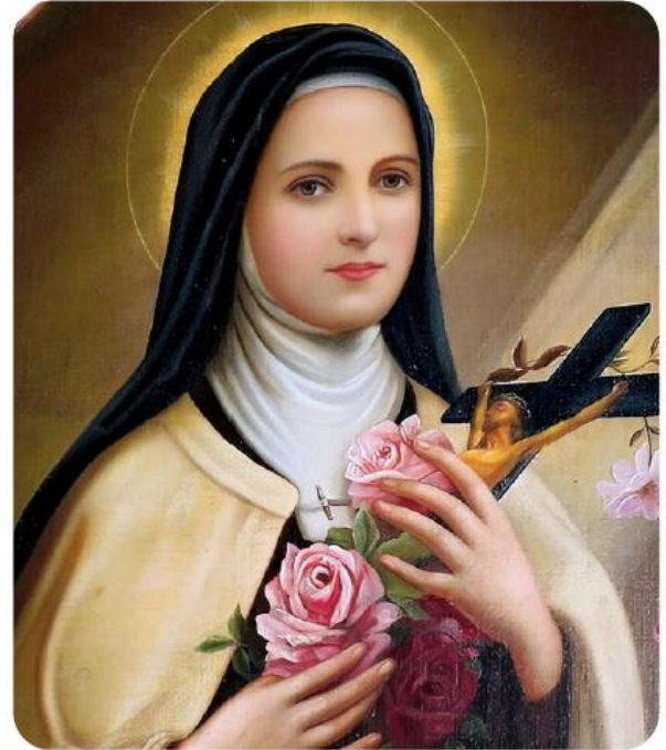
Saint Thérèse of Lisieux

Thánh Têrêsa Hải Đòng Giêsu, “Bông hoa nhỏ”, đã thấu hiểu sâu xa Trái Tim hiền lành và khiêm nhường của Chúa Giêsu. Khi suy niệm về việc để tình yêu Đức Kitô biến đổi mình, thánh nữ viết: “Điều làm Chúa Giêsu đẹp lòng là khi Người thấy tôi yêu mến sự bé nhỏ và nghèo khó của mình, cùng niềm hy vọng mù quáng mà tôi đặt nơi Lòng Thương Xót của Người... Càng yêu đuối, càng không có ước muốn hay nhân đức riêng, thì càng thích hợp hơn để tình yêu thiêu đốt và biến đổi ấy hoạt động.” Chúng ta hãy hiệp cùng thánh Têrêsa cầu xin cho tâm hồn mình được trở nên khiêm nhường như Chúa Giêsu: