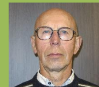
Catering Adam Adelin