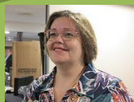
Beheer website/ Facebook Schietse Kristel