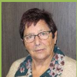
Secretariaat Demey Roos