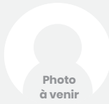
Photo à venir