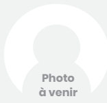
Photo à venir