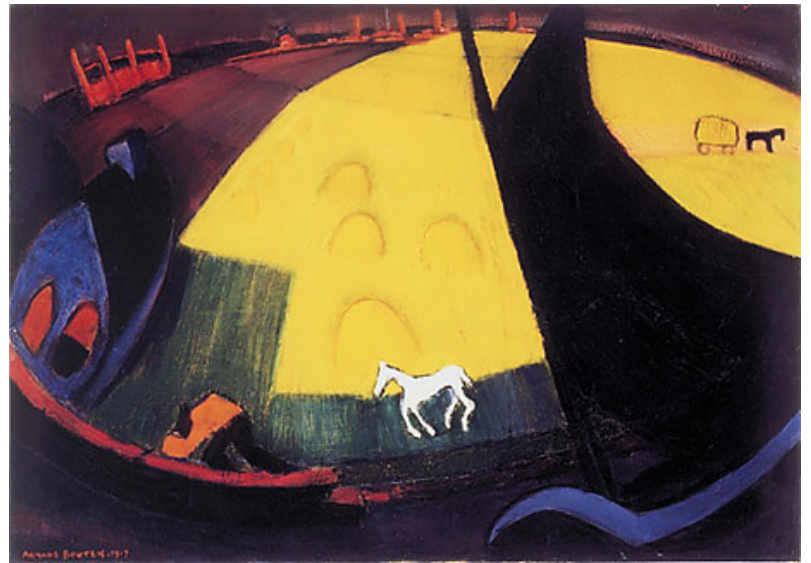
Paysage, 1917, 66 x 95,5 cm, Öl auf Leinwand