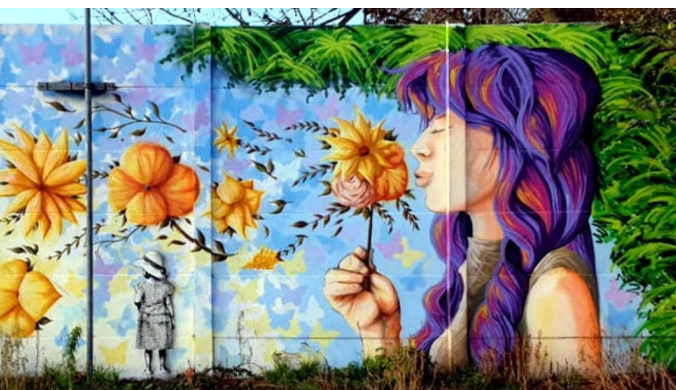
Le Printemps ? (peinture murale à Lomme, près de Lille)

aura lieu à l'Université de Lille les 25-26-27 mai 2027. Il se place dans le sillage des trois précédents colloques, Lille (2011), Paris (2019 & 2023) qui ont permis d'établir la pertinence scientifique et l'agentivité de la Recherche biographique, et plus généralement du Paradigme du Biographique, dans ses différents courants à l'ère que nous figurons sous le terme d' Anthropocène .