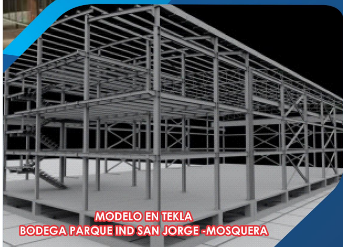
MODELO EN TEKLA BODEGA PARQUE IND SAN JORGE -MOSQUERA