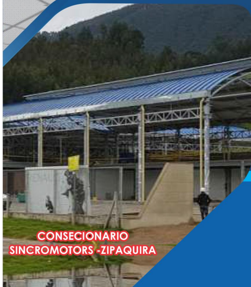
CONSESIONARIO SINCROMOTORS -ZIPAQUIRA