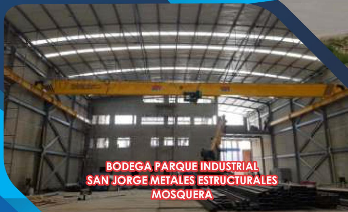
BODEGA PARQUE INDUSTRIAL SAN JORGE METALES ESTRUCTURALES MOSQUERA