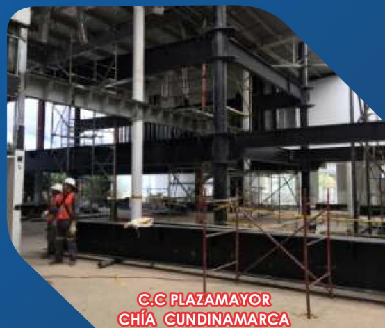
C.C PLAZAMAYOR CHÍA CUNDINAMARCA