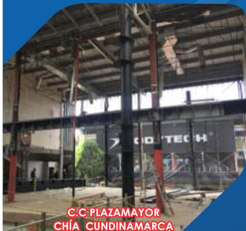
C.C PLAZAMAYOR CHÍA CUNDINAMARCA