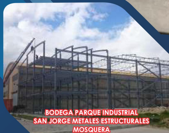
BODEGA PARQUE INDUSTRIAL SAN JORGE METALES ESTRUCTURALES MOSQUERA