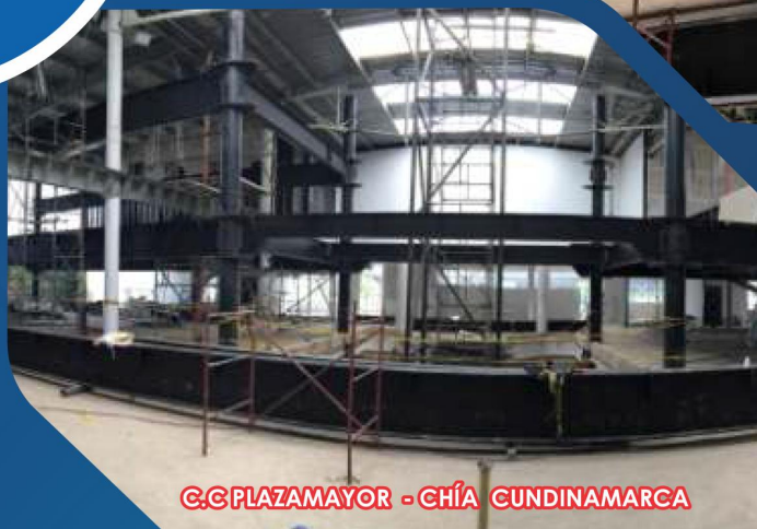
C.C PLAZAMAYOR - CHÍA CUNDINAMARCA