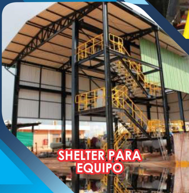
SHELTER PARA EQUIPO