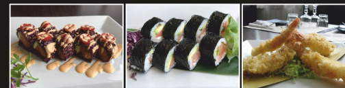
BLACK SPICY SAKE