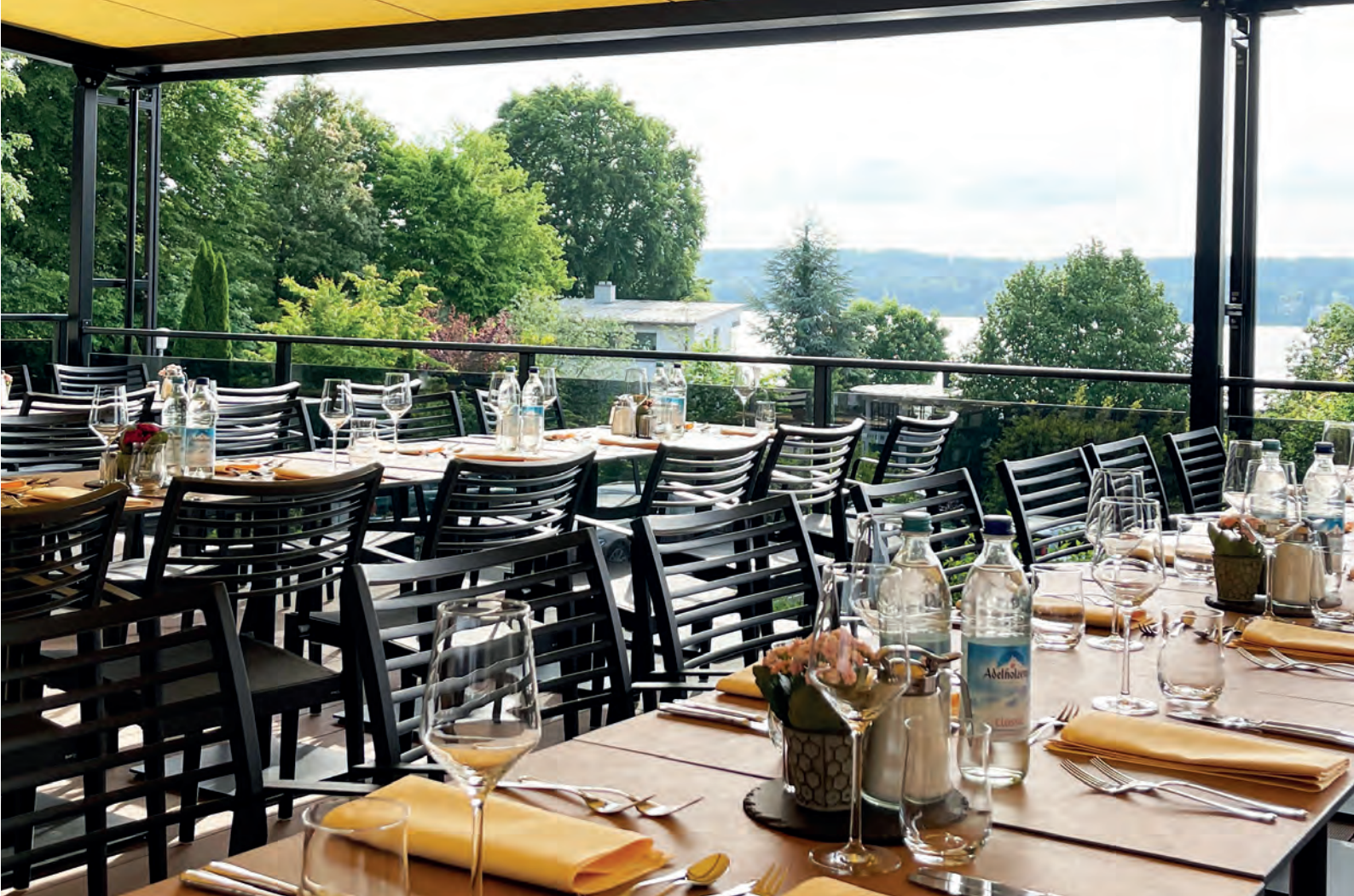
Business-Lunch auf unserer Terrasse mit Blick auf den Starnberger See