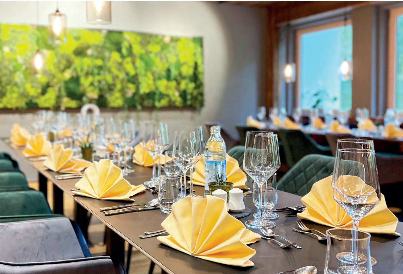
Abendessen in unserem Speisezimmer