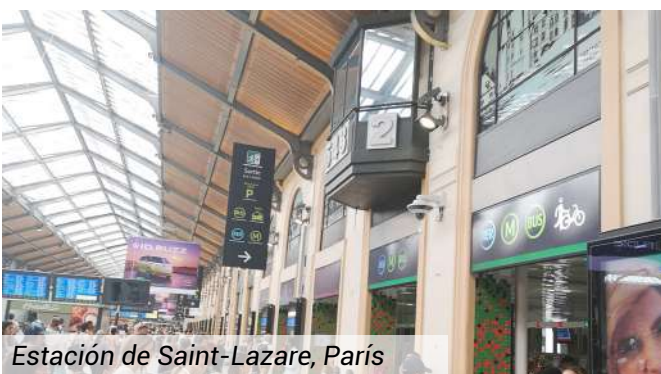
Estación de Saint-Lazare, París