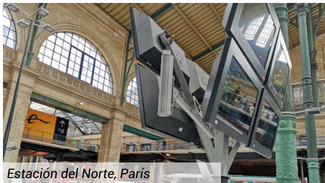
Estación del Norte, París