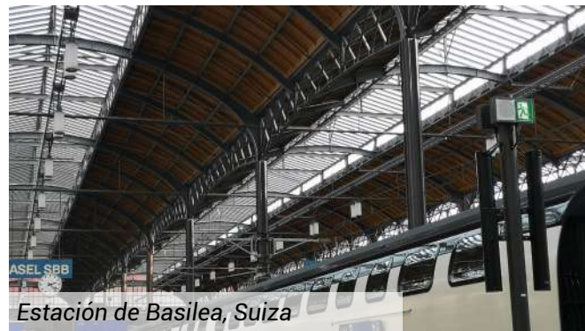
Estación de Basilea, Suiza