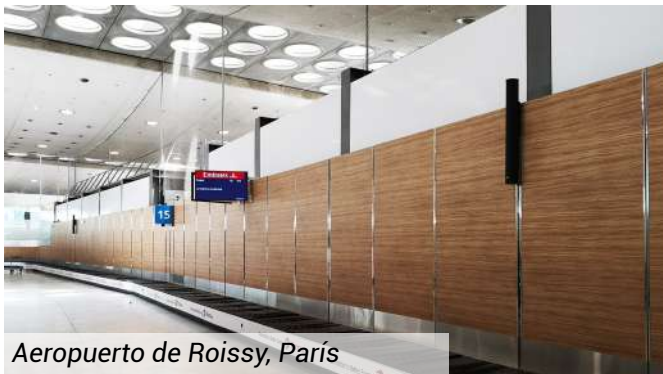
Aeropuerto de Roissy, París