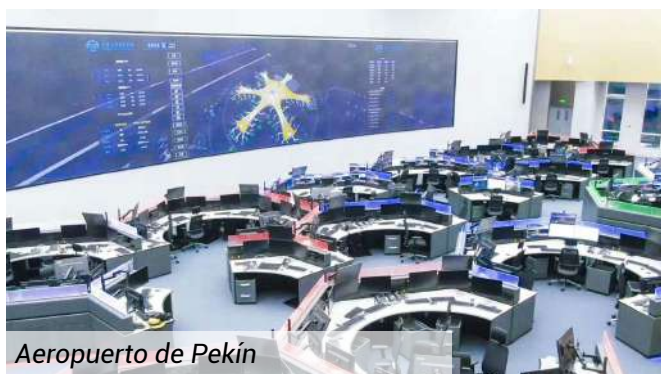
Aeropuerto de Pekín