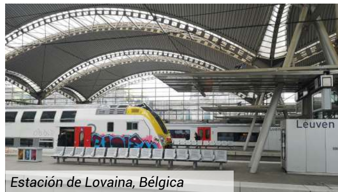
Estación de Lovaina, Bélgica