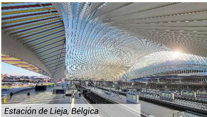
Estación de Lieja, Bélgica