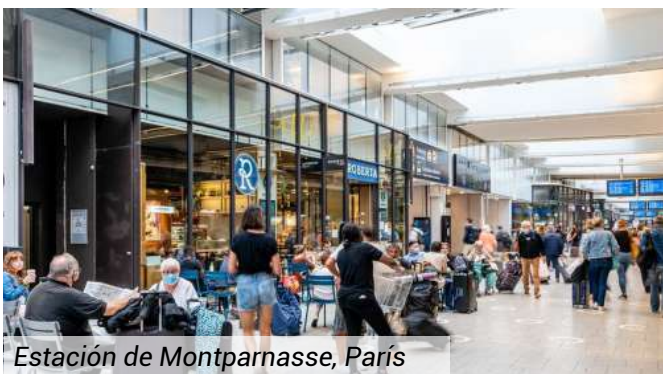
Estación de Montparnasse, París