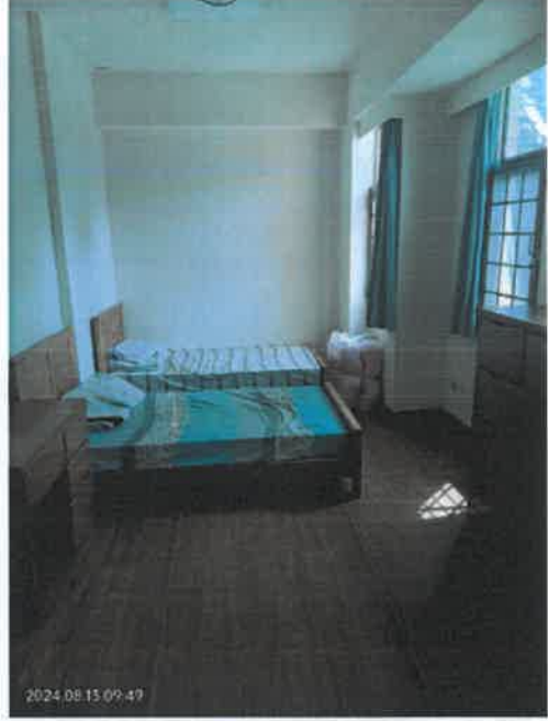
房間房間床鋪組裝