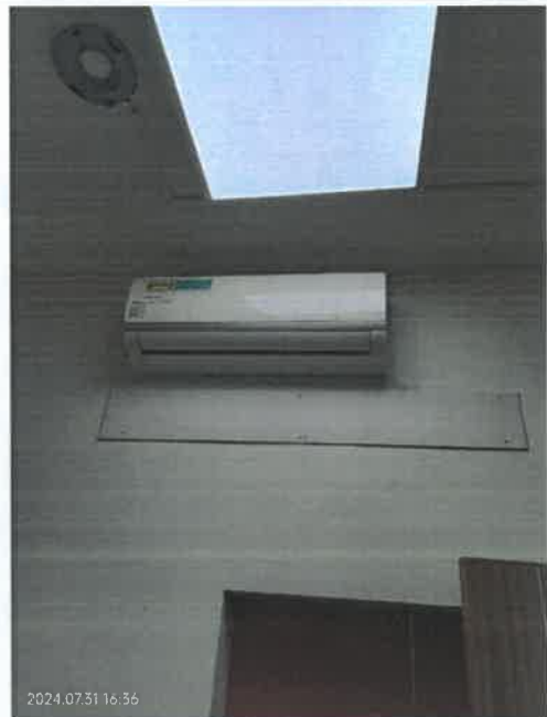
空調出口封板前後