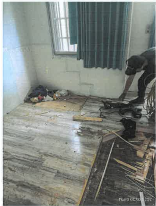
房間床組及地墊拆除