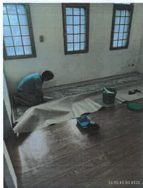
房間床組及地墊拆除