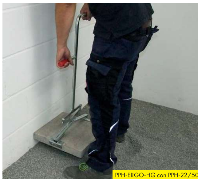
PPH-ERGO-HG con PPH-22/50