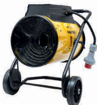
RS 40 - Ø 51 cm