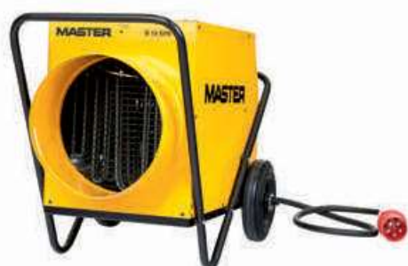
B 18 - Ø 31 cm B 30 - Ø 41 cm