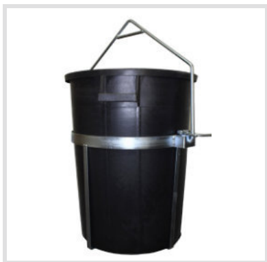
Art. 24013 Secchio da tiro