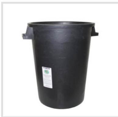
Art. 24014 Ricambio Fustino

Materiale: Plastica Portata: 120 Kg Peso: 9 Kg Struttura metallica: Acciaio zincato Fondo esterno in lamiera ZN 8/10