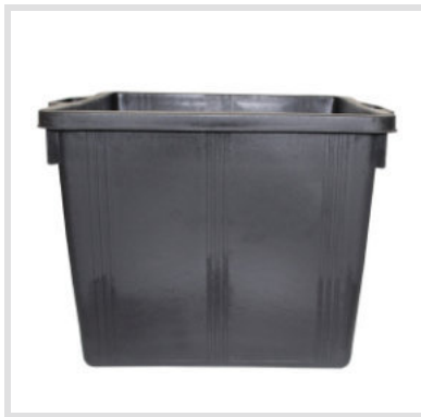
Art. 24008 Ricambio Contenitore

Materiale: Plastica Portata: 50 Kg Peso: 6,0 Kg Struttura Metallica: Acciaio zincato Fondo esterno in lamiera zincata 8/10