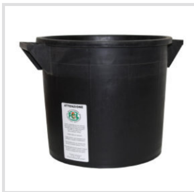
Art. 24002 Fustino

Materiale: Plastica Portata: 50 Kg Peso: 5,0 Kg Struttura Metallica: Acciaio zincato Fondo esterno in lamiera zincata