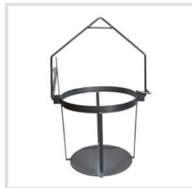
Art. 24015 Struttura

Materiale: Plastica Capacità: 100 Litri Ricambio per secchio da tiro art. 24013