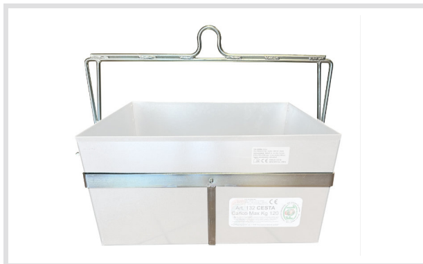
Art. 23004 Struttura