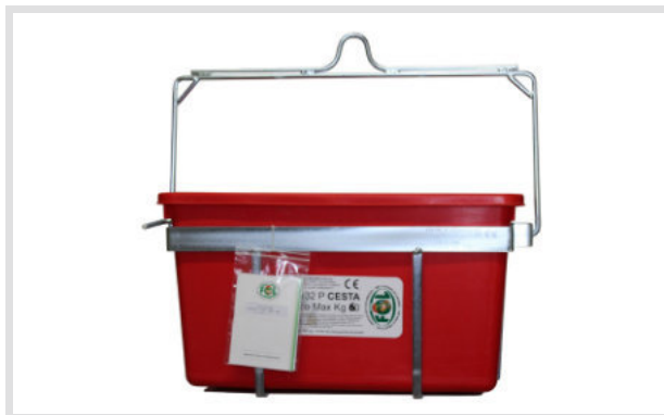
Art. 23002 Cesta