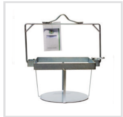
Art. 24009 Struttura

Materiale: Plastica Capacità: 40 Litri Ricambio per secchio quadro art. 24007