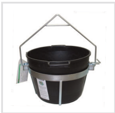
Art. 24010 Cesta Mastellotto

Peso: 3,50 Kg Altezza: 550 mm Ingombro: 380x480 mm Struttura per secchio quadro art. 24007