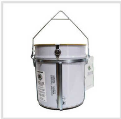
Art. 24019 Fustino con supporto