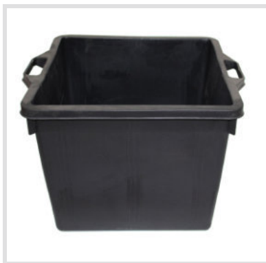
Art. 24017 Ricambio Contenitore

Materiale: Plastica Dimensione: 475x475x360 Capacità: 60 Litri Portata: 80 Kg Struttura: Acciaio zincato Peso: 8,50 Kg