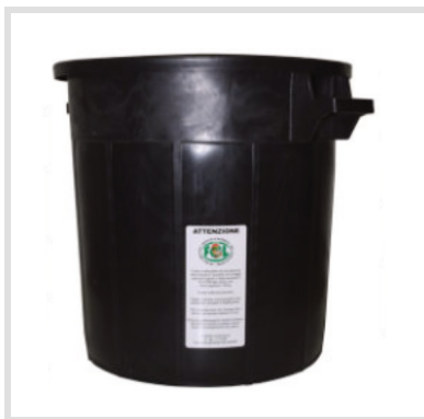
Art. 24005 Fustino

Materiale: Plastica Portata: 100 Kg Peso: 7,0 Kg Struttura Metallica: Acciaio zincato Fondo esterno in lamiera zincata