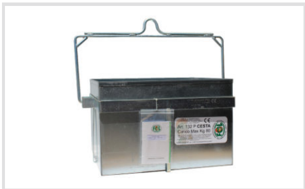
Art. 23001 Cesta Media