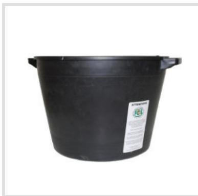
Art. 24011 Ricambio Contenitore

Materiale: Plastica Portata: 75 Kg Peso: 5 Kg Struttura metallica: Acciaio zincato Fondo esterno in lamiera ZN 8/10