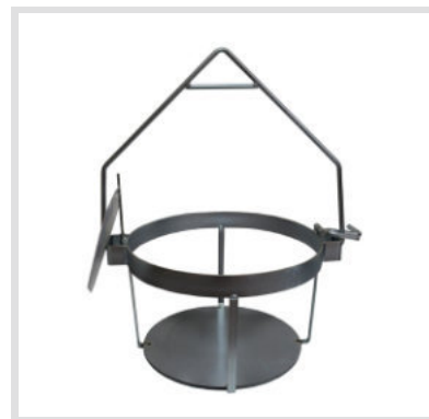
Art. 24003 Struttura

Materiale: Plastica Capacità: 35 Litri Ricambio per secchio da tiro art. 24001