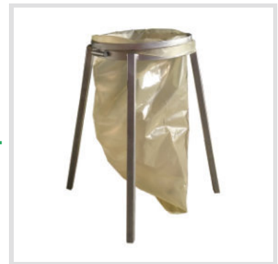
Art. 25001 Porta sacco per calcinacci