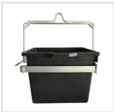
Art. 24016 Secchio Quadro

Peso: 7,00 Kg Altezza: 850 mm Ingombro: 580 mm Struttura per secchio da tiro art 24013