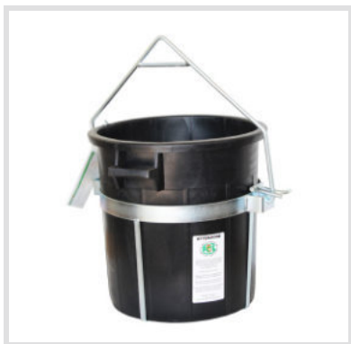
Art. 24004 Secchio da tiro

Altezza: 550 mm Ingombro: 490 mm Peso: 3,5 Kg Struttura per secchio da tiro art. 24001