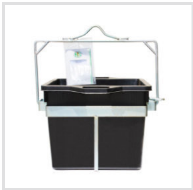
Art. 24007 Secchio Quadro