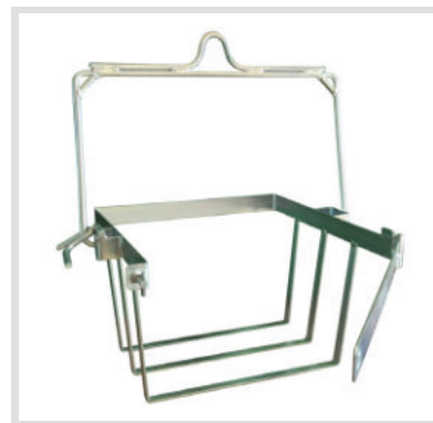
Art. 24018 Struttura

Materiale: Plastica Capacità: 60 Litri Ricambio per secchio quadro art. 24016