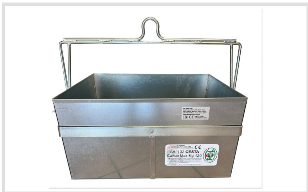
Art. 23003 Cesta Metallica