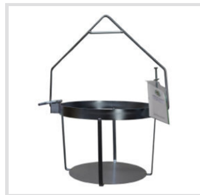
Art. 24006 Struttura

Materiale: Plastica Capacità: 50 Litri Ricambio per secchio da tiro art. 24004