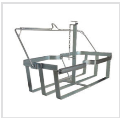
Art. 24022 Struttura ceste