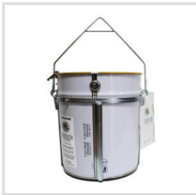
Art. 24020 Fustino con supporto e blocca manico

Stesse caratteristiche ma versione con blocca manico.