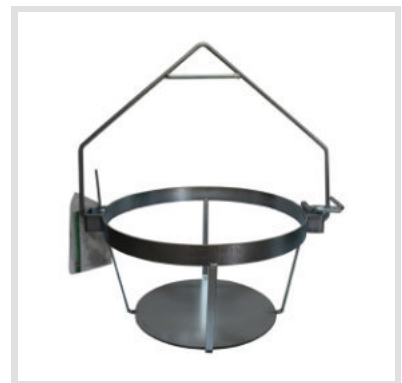
Art. 24012 Struttura

Materiale: Plastica Capacità: 40 Litri Ricambio per cesta mastellotto art. 24010