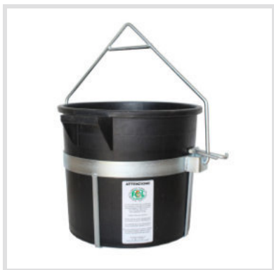
Art. 24001 Secchio da tiro