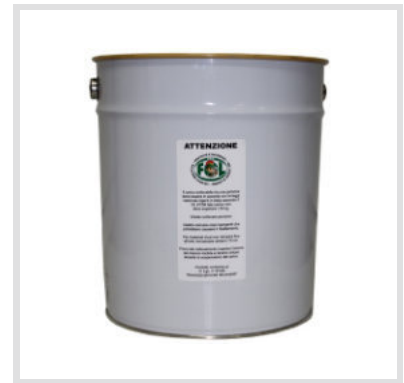
Art. 24021 Secchiello Metallo

Stesse caratteristiche ma versione con blocca manico.