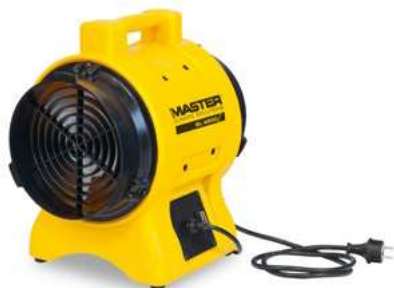
BL 4800 BL 6800