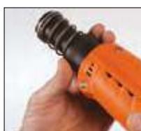
3. Svitare la canna