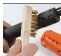
4. Spazzolare l'esterno e l'interno della canna