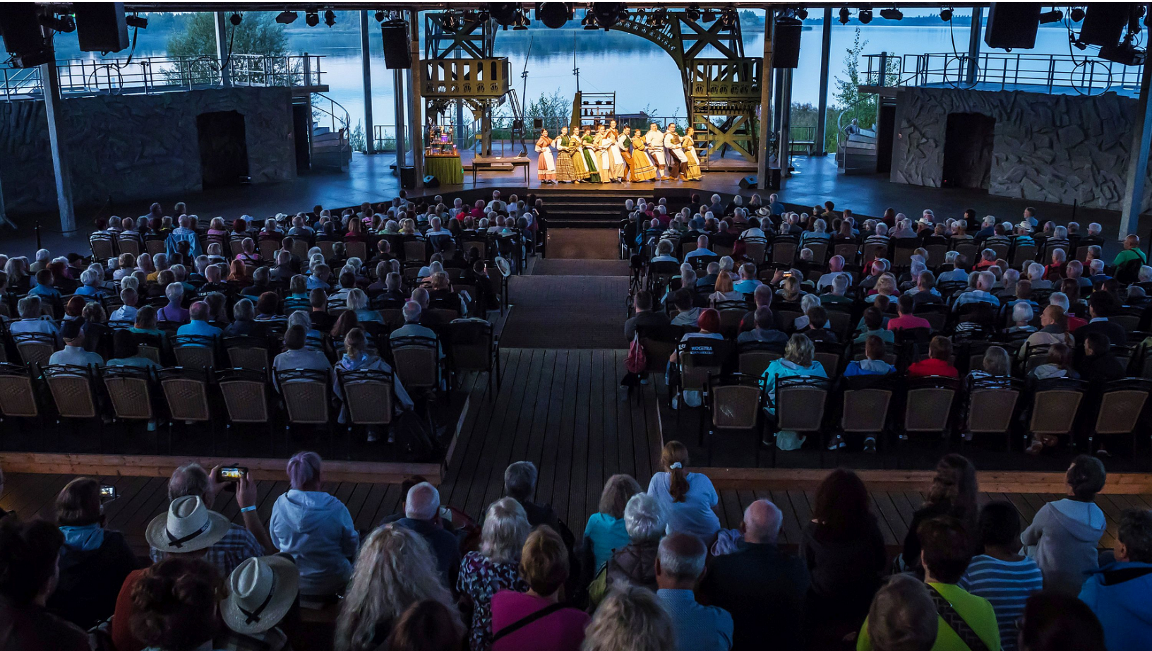
Seebühne am Biedermeierstrand des Schladitzer Sees: Aufführung eines Musicals - Foto: Maximilian Zwiener