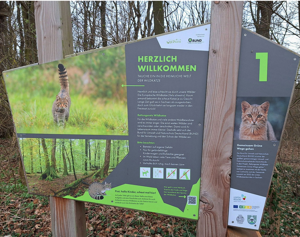
Schautafel entlang des 2 km langen Wildkatzenlehrpfads in Heyda (Lossatal)