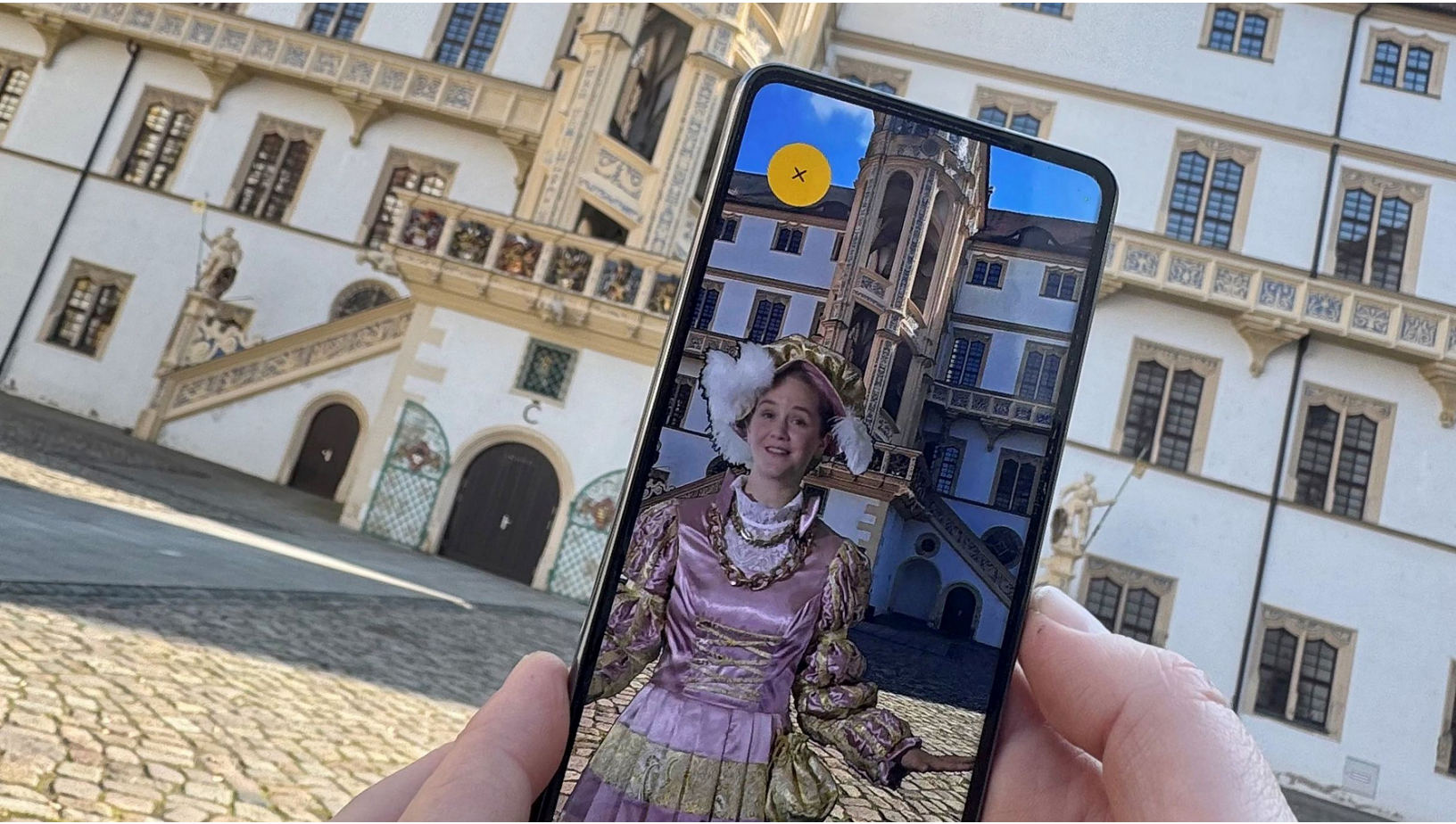
Der Avatar von Kurfürstin Sibylle auf dem Hof von Schloss Hartenfels in Torgau