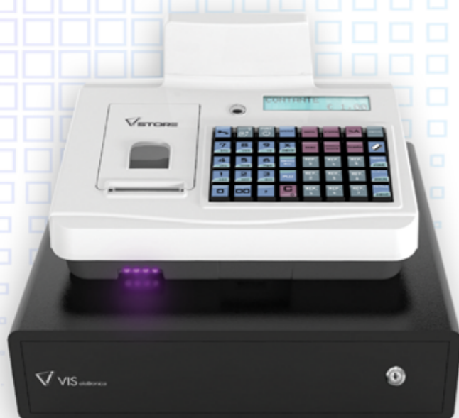
Sistema di fissaggio su cassetto Dual Lock

5 operatori base fino ad 8 con espansione di memoria - 16 caratteri di descrizione per ciascun operatore - Password numerica da 1 ad 8 cifre. Nessun limite giornaliero di cambio operatore - Gestione abilitazione/disabilitazione sconti/maggiorazioni per ogni singolo operatore