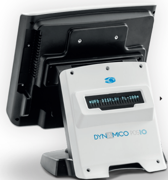
DISPLAY CLIENTE INTEGRATO