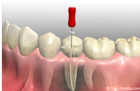
Wurzelbehandlung eines zerstörten Zahnes

Wurzelbehandlungen werden generell mit Betäubung durchgeführt. Deshalb sind sie in aller Regel nicht schmerzhaft . In seltenen Fällen (wenn ein Zahnnerv sehr stark entzündet ist), können trotz Betäubung während der Behandlung vorübergehend Schmerzen auftreten.