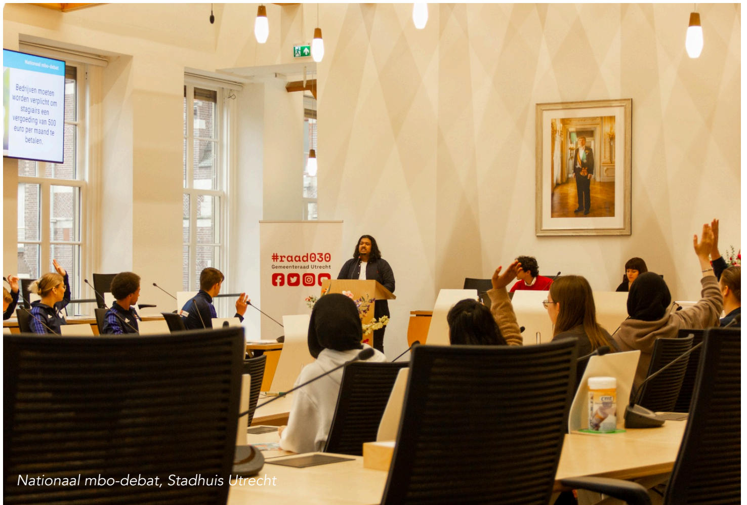
Nationaal mbo-debat, Stadhuis Utrecht