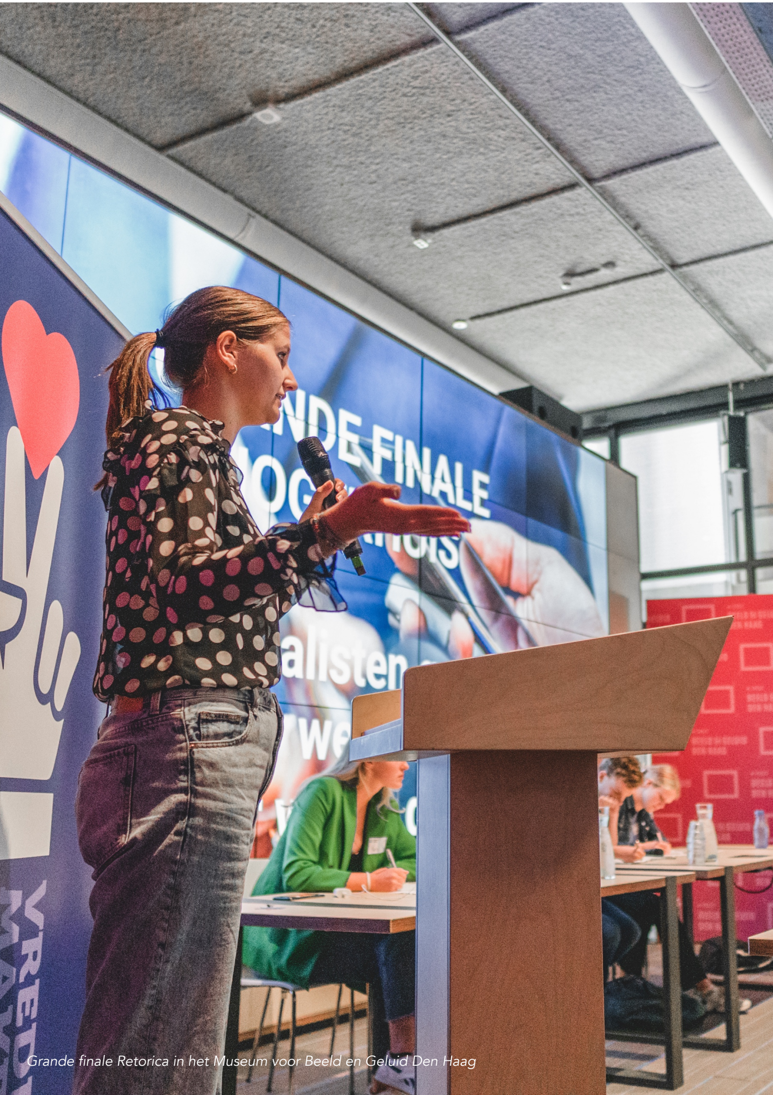
Grande finale Retorica in het Museum voor Beeld en Geluid Den Haag