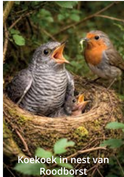
Koekoek in nest van Roodborst

Nao dè gebruuju make vogels pas echt overure. Ze sjouwe d'r eige unnen breuk. Diej klèèn krielkes zonder virkes hebbe unne groten bek diej den hillen dag ope gao. Komme de aaw luij d'r an, dan kwèke ze um 't hardst um an te geve dè den honger nie langer te harde is.